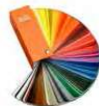
MOD. GÉNESIS NEUTRA