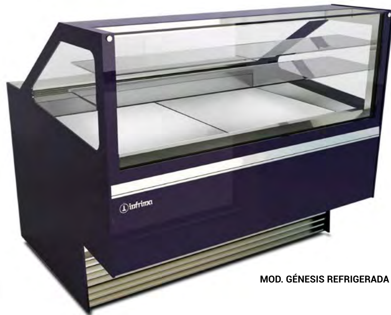
MOD. GÉNESIS REFRIGERADA

VITRINA PASTELERÍA MOD. GÉNESIS GENESIS BAKERY SHOWCASE